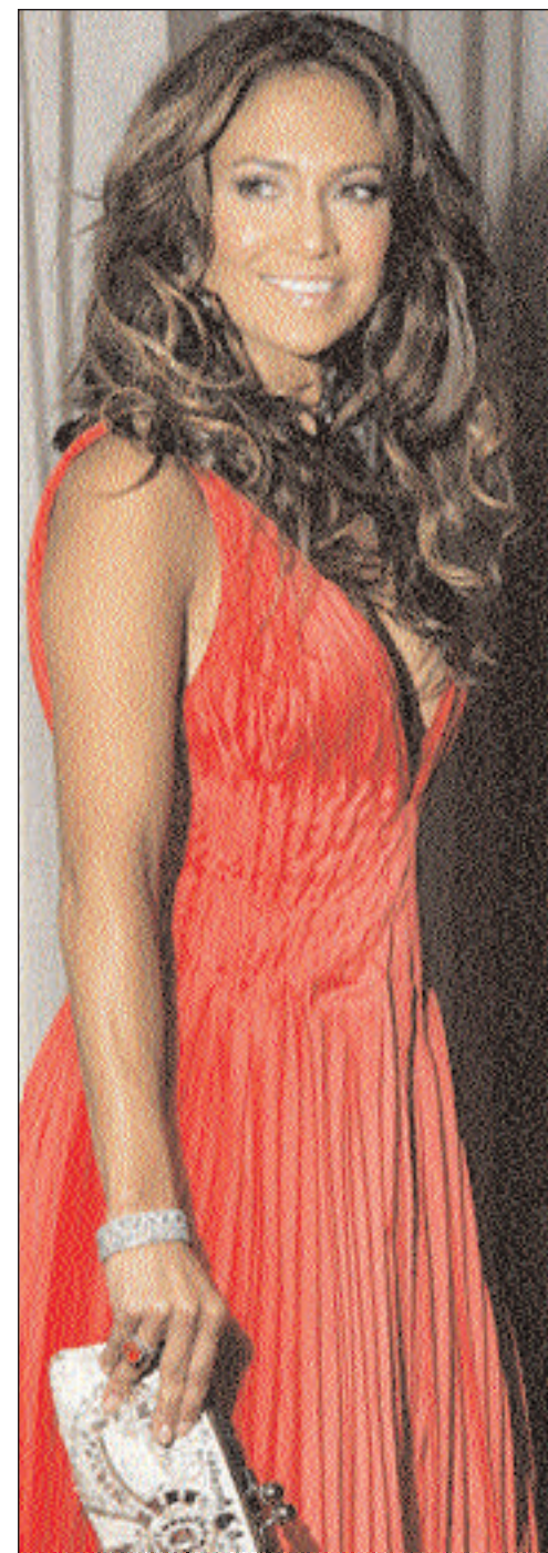
Lady in red: Jennifer Lopez er aktuell med ny plate og ny film, der hun spiller mot stjerrelkene Robert Redford og Morgan Freeman.

«An unfinished life» handler om en mor som flytter inn hos sin svigerfar for å klare å forsørge sin datter. Filmen har Robert Redford og Morgan Freeman i andre store roller. Produksjonen skulle egentlig hatt premiere i USA i desember for å kunne ha en sjanse til å konkurrere om Oscar-prisene i februar, men er nå flyttet til mars.